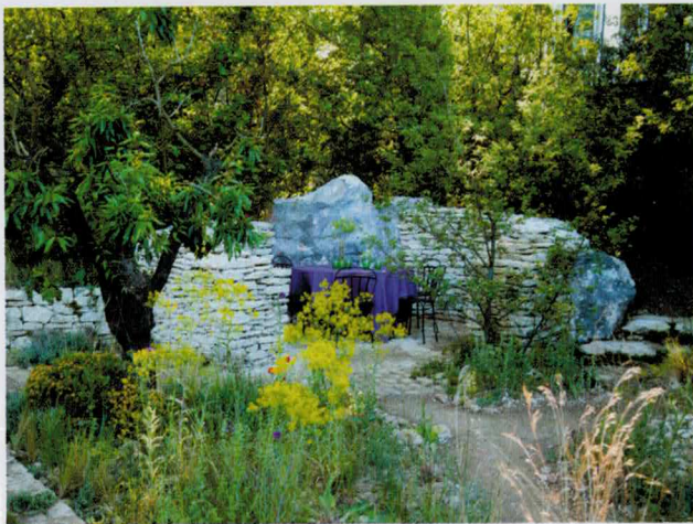
« Occitane Garden », de James Basson, Chelsea Flower Show 2017